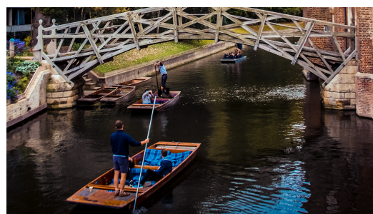
(图：剑桥大学康河风光)